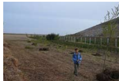
Výsledek jednání s firmou ASA

Podařilo se vyvolat jednání s firmou ASA za účasti zástupců naší městské části a občanského sdružení. Výsledkem je skutečně rozšíření ochranného zeleného pásu.