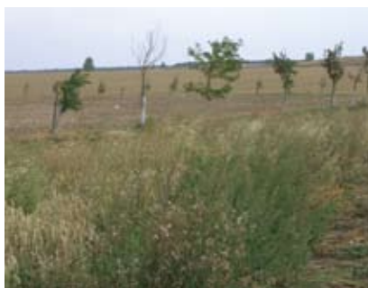
Ochranný pás před jednáním s firmou A.S.A

V projektové dokumentaci je zakreslen 20m pás zeleně vně plotu skládky na západní straně, který začíná u stávajícího biokoridoru a postupně se odklání. Dle Průvodní zprávy na str. 3 nahoře je stanoveno, že dojde v předstihu k založení v projektu uvedeného zeleného pásu. Dle dopisu stavebníka p. Hladíka byl zelený pás založen v březnu t.r., ale jeho rozsah neodpovídá projektu. Pás nemá odpovídající šířku a stromy, jak bylo zjištěno kontrolou na místě, jsou téměř z 1/3 mrtvé, další část je silně poškozena, takže nebudou plnit svoji funkci.